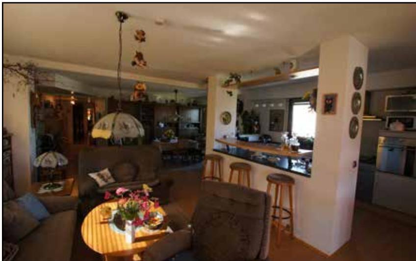
Einzelaufnahme mit einem Weitwinkelobjektiv

Verzeichnungen entstehen bei Aufnahmen mit sehr großem Bildwinkel. Bei der Panoramafotografie werden statt nur einem Bild mehrere Bilder mit einem speziellen Panoramaadapter angefertigt und am Computer zusammengesetzt. Es entsteht ein fast verzeichnungsfreies Bild