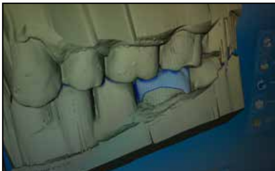
Darstellung des Implantates