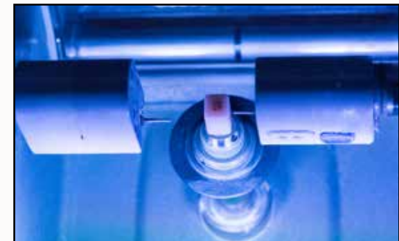
Anfertigung des Implantatzahnes