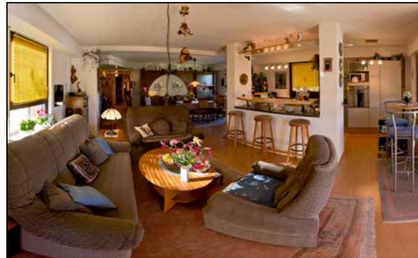
Aufnahme mit Panoramaadapter (5 Einzelbilder)